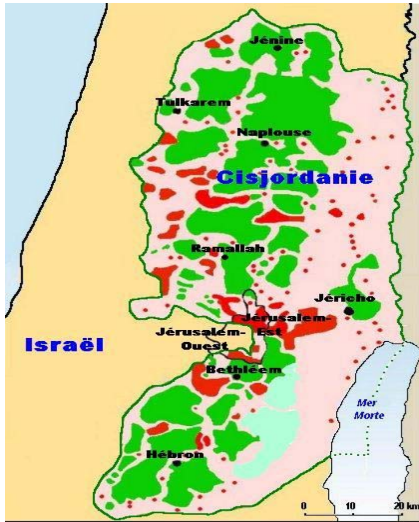
Situation en janvier 2000